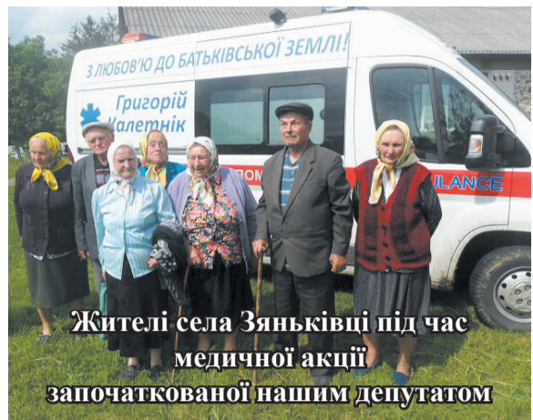
Жителі села Зяньківці під час медичної акції започаткованої нашим депутатом

Медичні реформи, які останнім часом проводились українським Урядом, на жаль, не поліпшували, а лише погіршували становище медицини, тому на окрузі у цьому плані доводилось підставляти