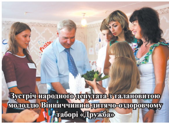
Зустріч народного депутата з талановитою молоддю Вінниччини в дитячо-оздоровчому таборі «Дружба»

Щорічно до Дня святого Миколая та Нового року учні шкіл, дитячих садків, -педагогічний та технічний персонал, вихователі, багатодітні родини отримують подарунки, а це 8368 осіб. Стараюсь особисто брати участь у врученні подарунків, по можливості відвідати багатодітні