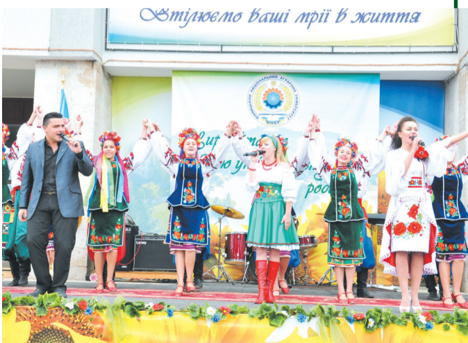
Дякую батькам за таких талановитих дітей, що підкоряють серця глядачів в Україні та за кордоном

Я працював і працюватиму задля підвищення їх добробуту і благополуччя.