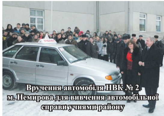
Вручення автомобіля НВК № 2 м. Немирова для вивчення автомобільної справи учнями району