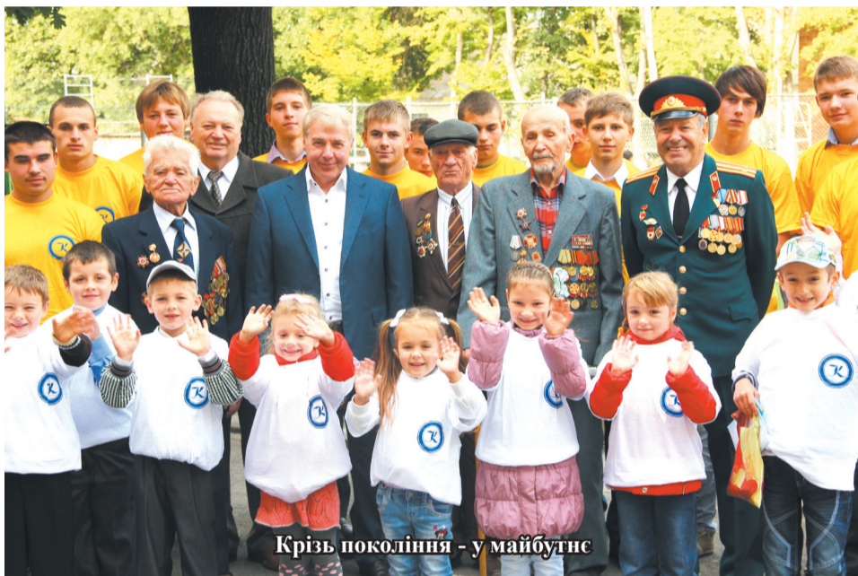
Крізь покоління - у майбутнє

Указом Президента України повноваження Верховної Ради України VII скликання припинені достроково. За ці неповні два роки вдалось реалізувати лише частину тієї нашої з вами програми, яку ми сформували на п'ять років. Із 322 сіл, селищ та міст округу я встиг особисто зустрітись із виборцями у 110 територіальних громадах. Але в кожному районі, селі працювали мої помічниками та волонтери, які знаходили стежину до шкіл, садочків, ФАПів, які тісно співпрацювали із депутатами сільських, районних рад, головами територіальних громад та керівниками господарств, директорами освітніх та дошкільних закладів, медичними працівниками, бібліотекарями.