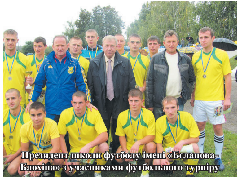
Президент школи футболу імені «Беланова-Блохіна» з учасниками футбольного турніру

Найулюбленишим, наймасовішим спортом в сільській місцевості був і залишається футбол. Подальший розвиток гарних традицій з цього виду спорту в Немирівському районі потребував фінансової та матеріальної підтримки.